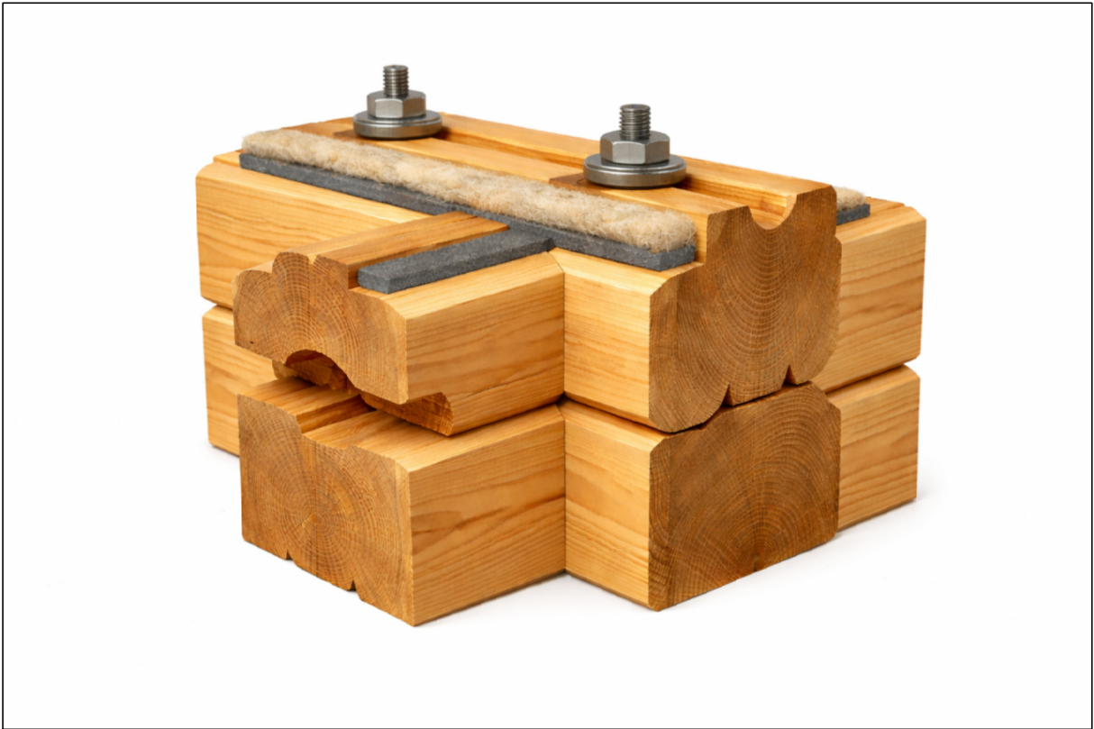
WARIANT 1: - ŚCIANA JEDNORODNA - BALE DREWNIANE 40/20cm